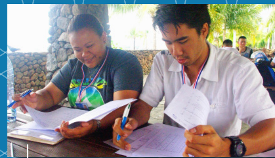
Enquête SMPG à Tahiti